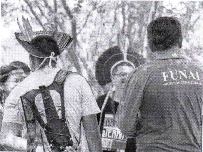
SAÚDE indígena tem desafios em todos os territórios pelo Brasil

RUBENS RODRIGUES rubens.rodrigues@opovo.digital.com