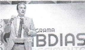
Ministro da Educação, Camilo Santana, repaginado