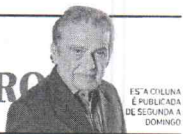
ES A COLUNA É PUBLICADA DE SEGUNDA A DOMINGO

Algumas de minhas últimas intervenções no Minuto da CBN, preferencial de minhas classes favoritas, pois acentuadamente radiofônicas.