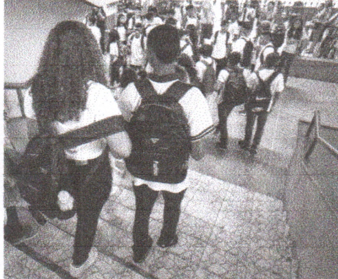
NA ESCOLA de Ensino Médio Dr. César Cals, o retorno dos alunos será gradual