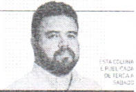
ESTA COLUNA É PUBLICADA DE TERÇA A SÁBADO