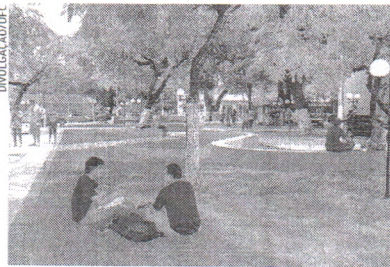
BOSQUE Moreira Campos, no Centro de Humanidades I, na Universidade Federal do Ceará, antes da pandemia

PADEMIA | Estudantes iniciam ensino superior de forma remota e sem os vínculos com a universidade