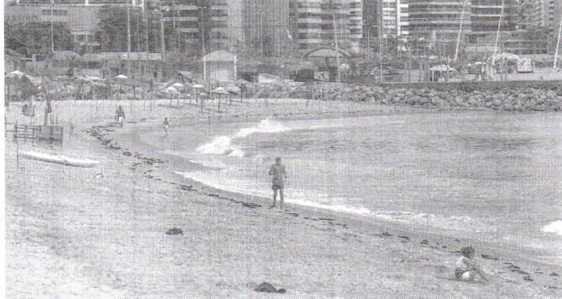
A TAXA de ocupação dos hotéis da Capital, que era de 10% no dia 1º de abril, deve passar para 30% já na primeira quinzena de maio

estivéssemos em condições de normalidade. Nesse primeiro momento, vai ser mais o turismo regional, muita gente que vem até de fora, por conta da dificuldade de voos", avalia.