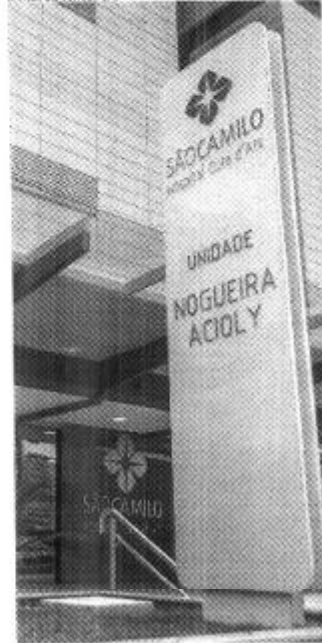
Na terça-feira, foram atendidos 100 pacientes com sintomas gripais no Hospital São Camilo